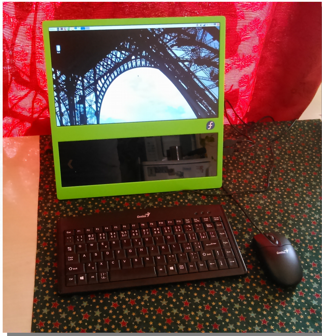
All in One PC – Pi-Top CEED – s běžící Fedorou